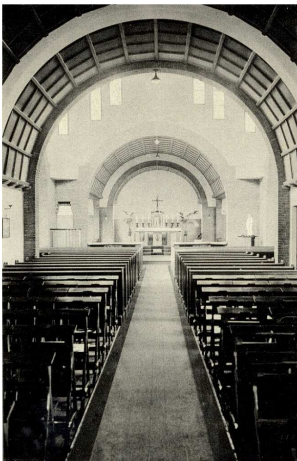
Interieur van de parochiekerk na de verbouwing in 1933