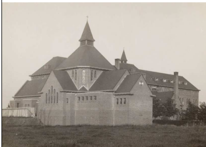
Kruisherenkerk met klooster, ca. 1933