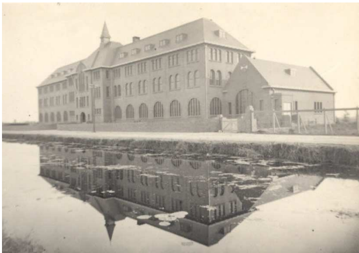
Kruisherenklooster Zoeterwoude, met rechts de kleine huiskapel die later tot kloosterkerk werd uitgebreid