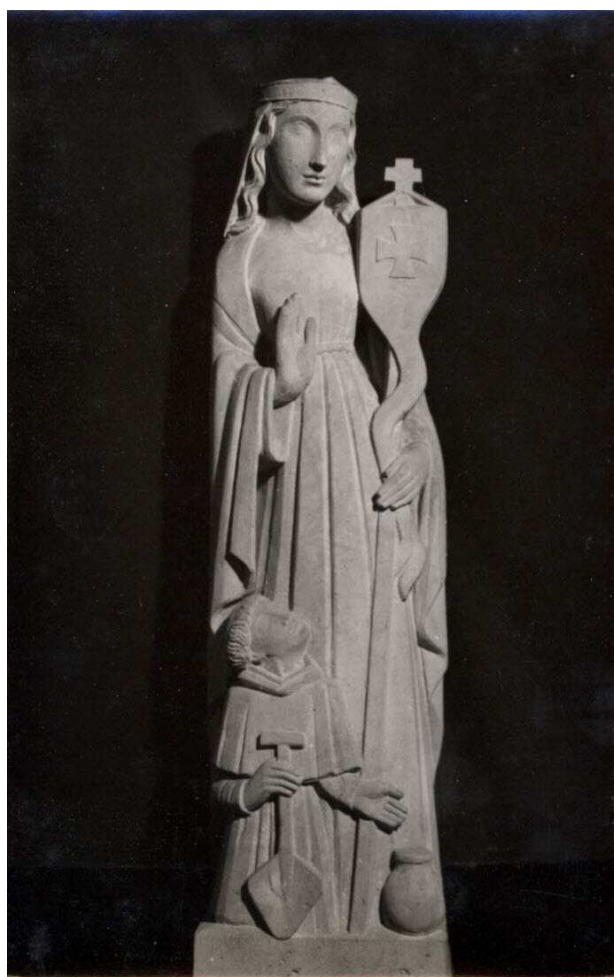
Odiliabeeld door de Nederlandse beeldhouwer Mari Andriessen (1897-1979)