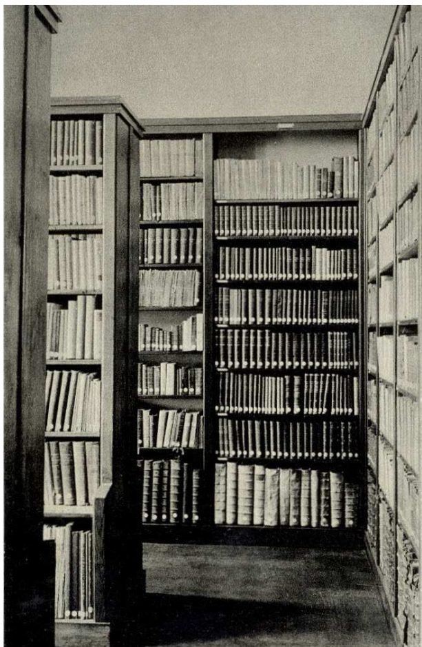
Klooster Zoeterwoude, bibliotheek

naar Achel, later naar Nijmegen en St. Agatha. De vernieuwing in de orde en in de Nederlandse provincie van de kruisheren liet hij met mildheid over zich heengaan, maar stelde hij: Ik snap er niet veel van, 't zal wel goed zijn, maar ik blijf dat doen wat ik altijd gedaan heb.