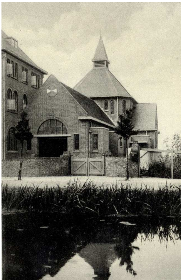
Ingang van de kerk naast het klooster

geloften legde hij af in St. Agatha op 28 augustus 1931. Hij trad uit met dispensatie in de solemnele geloften en het subdiaconaat op 17 april 1934.