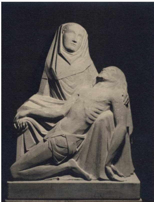
Piëta door de Nederlandse beeldhouwer Mari Andriessen (1897-1979)