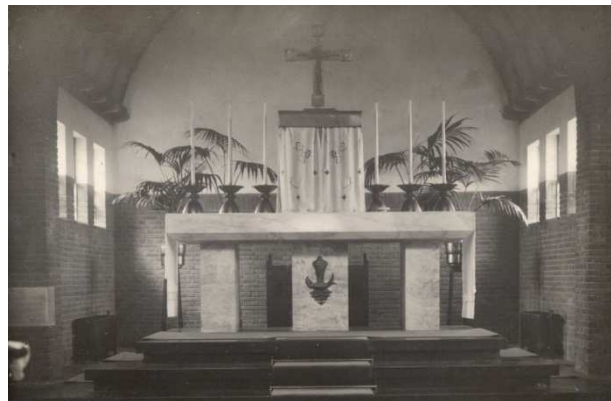
Hoofdaltaar in de kerk, ca. 1933