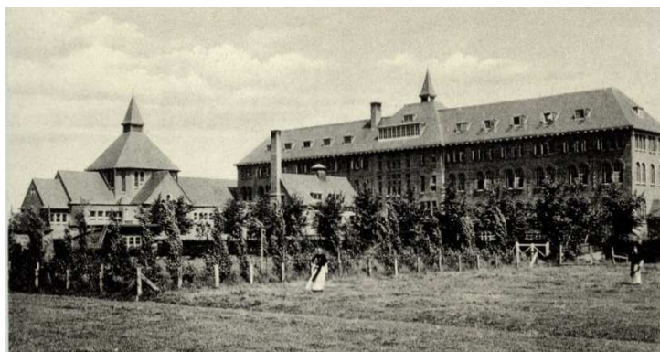
Klooster Zoeterwoude, achterzijde gebouw inclusief kerk

In de zomer van 1929 kwamen elf fraters naar Zoeterwoude. Zij waren aan het noviciaat begonnen in 1928. Zij studeerden filosofie van 1929 tot 1931 en daarna theologie in St. Agatha van 1931 tot 1935. Op