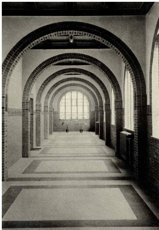
Kloostergang in Zoeterwoude