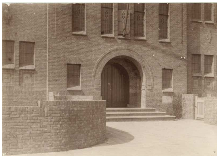
De hoofdingang toen en nu