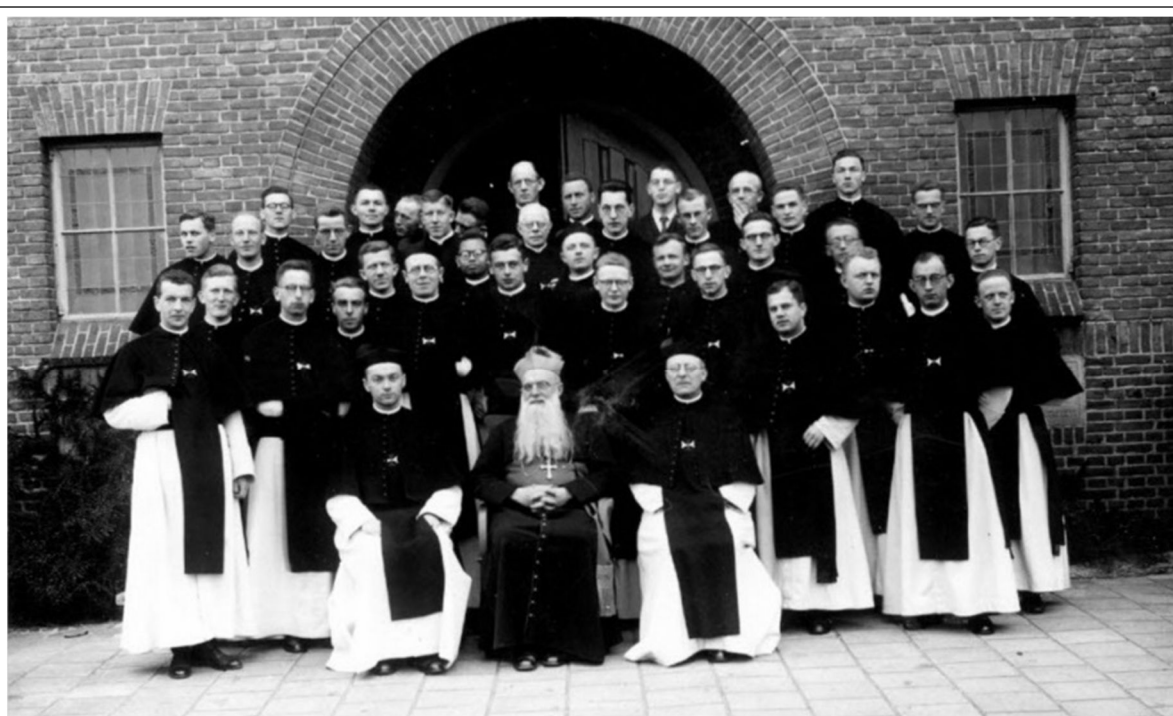
Zoeterwoude – het convent in 1938

Tijdens de paasvakantie 1938 vertoefde Henricus van Rooijen tien dagen in Parijs om er archiefonderzoek te verrichten in verband met de geschiedenis van de orde, heel in het bijzonder omtrent de geschiedenis van de heilige Odilia. Rond 15 juli reisde hij nogmaals naar Parijs om het archiefonderzoek voort te zetten. Hij verbleef er bij de petites sœurs de l'assomption.