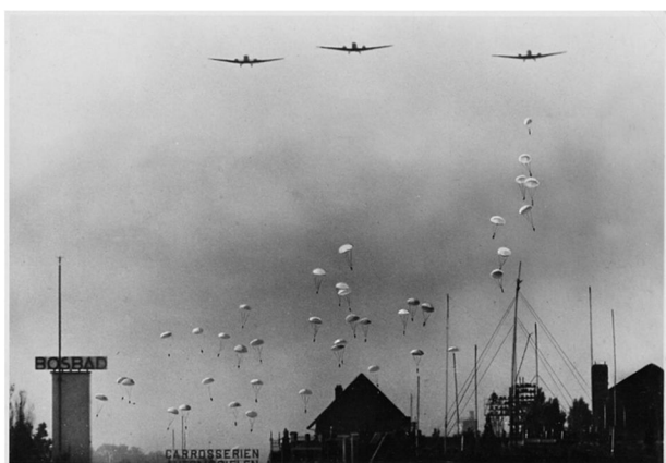
Duitse parachutisten in Holland, mei 1940

van de zeezijde. Het officiële tijdstip was vijf minuten vóór vier. Zonder voorafgaan- de oorlogsverklaring viel het Duitse leger Nederland binnen. De overmacht was over- rompelend. De Nederlandse militairen die, sinds in april 1940 de staat van beleg was afgekondigd, voorbereid waren op een mogelijke Duitse invasie, werden door het oorverdovende lawaai in hun slaap gewekt en velen vielen al snel als krijgsgevangenen in Duitse handen. Veel Nederlandse vlieg- tuigen werden in de vroege ochtend van 10 mei 1940 op hun basis vernietigd door Duitse bombardementen. Vliegtuigen die kans zagen op te stijgen, leverden indruk- wekkende prestaties, zeker als men beseft dat één Nederlands toestel doorgaans vijf tot tien Duitse opponenten tegenover zich vond. Het Duitse leger moest hoe dan ook een hoge prijs betalen voor de invasie in Nederland. De Brigade Luchtdoelartillerie vormde een levensgrote bedreiging voor de logge Duitse transportvliegtuigen. Door de luchtafweer werden ruim tweehonderd toe- stellen neergehaald. Het Duitse plan om de koningin en de regering gevangen te ne- men, was mislukt.