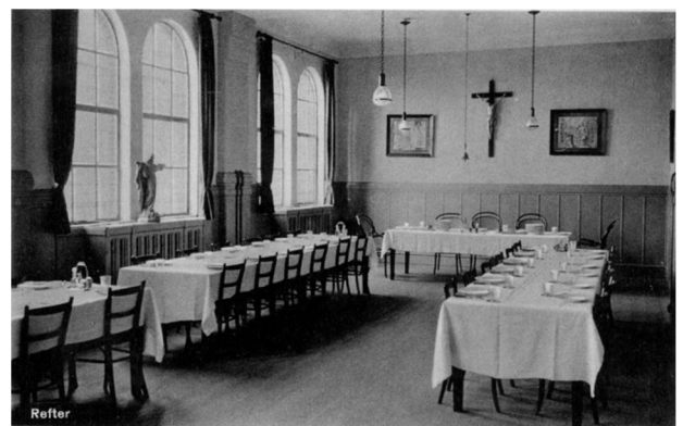
Zoeterwoude – refter